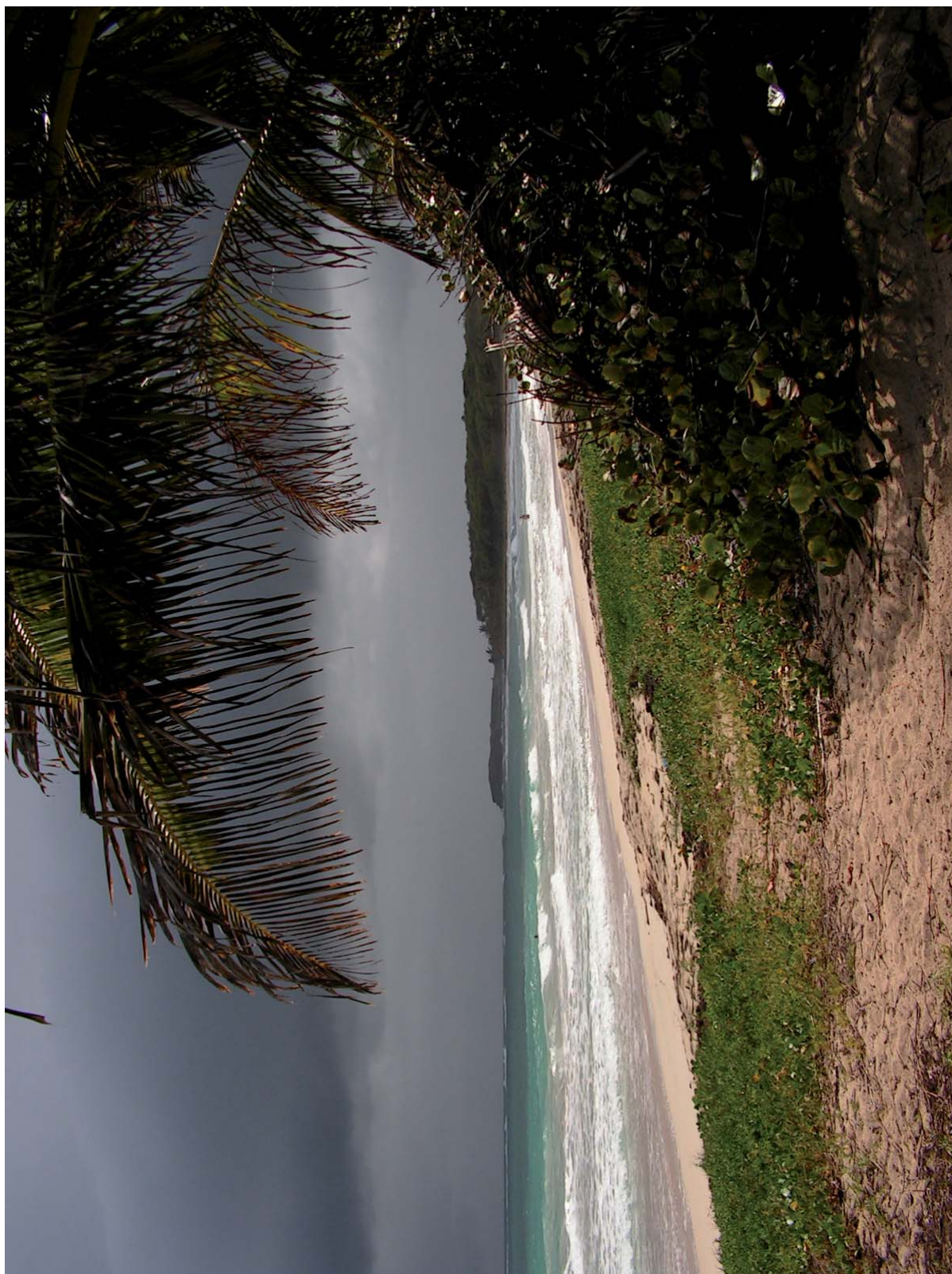
”Prins Henrik”, Karibien: Atlanterhavets bølger løber op ad øststranden, dvs. øernes luvside.