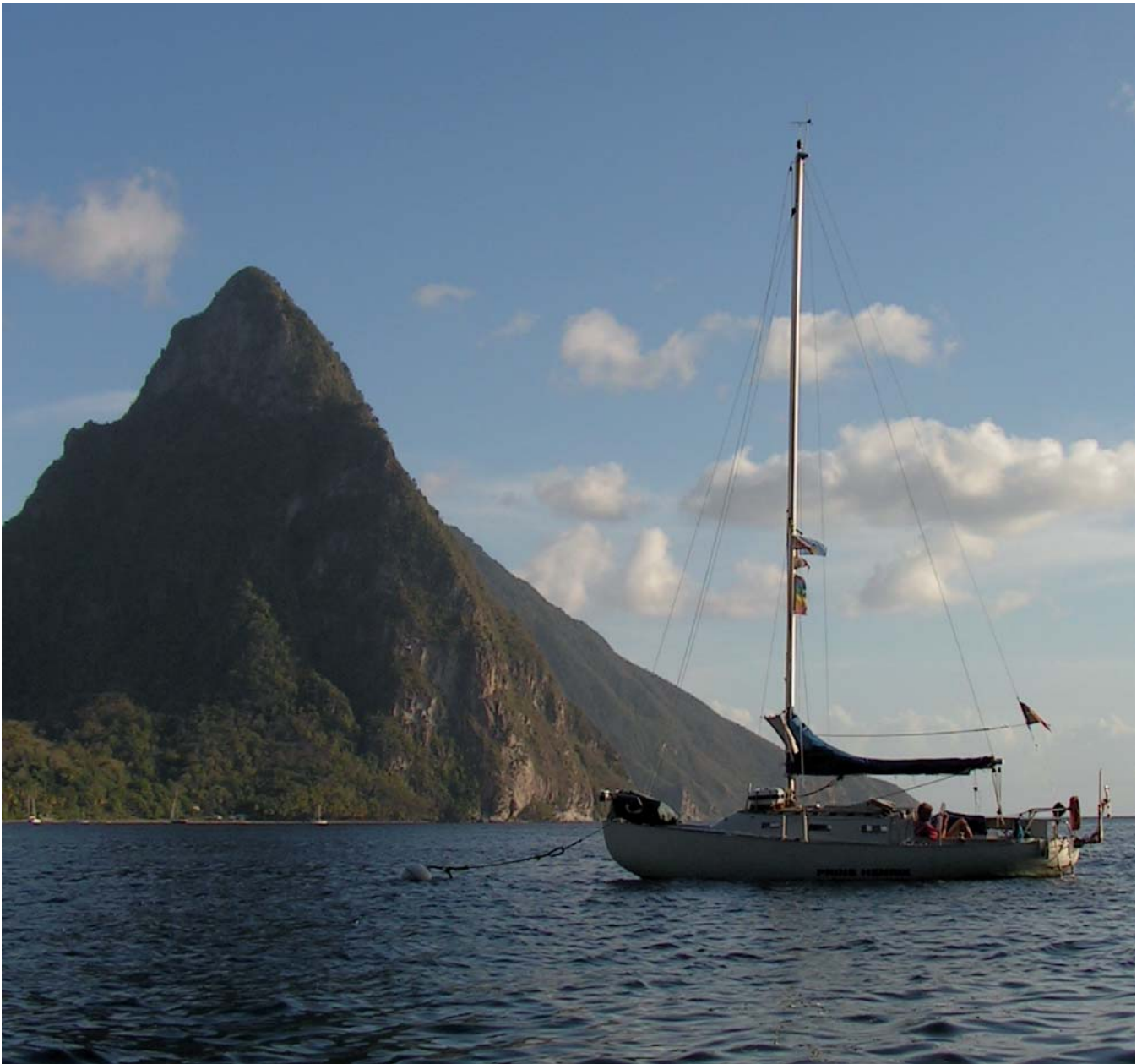
Vulkan: Ankerbugten under vulkanen Piton på St. Lucia

”Prins Henrik” i Karibien, læs beretningen side 4