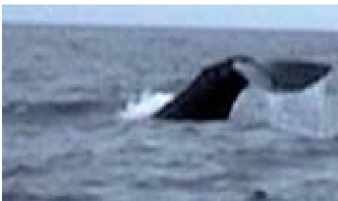
"Prins Henrik" og en hval: Denne hval krydsede vores kurs syd for Carriacou