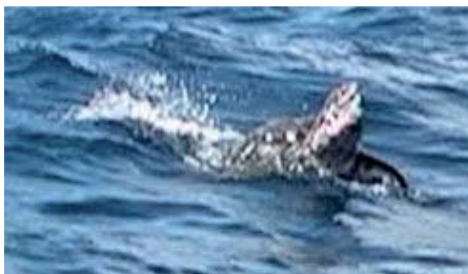
"Prins Henrik" og skildpaden: Vi troede først det var en hval